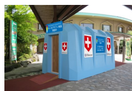
阿蘇ファームランド 「検温ハウス」